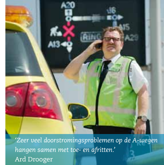
‘Zeer veel doorstromingsproblemen op de A-wegen hangen samen met toe- en afritten.’ Ard Drooger