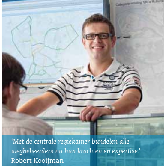
‘Met de centrale regiekamer bundelen alle wegbeheerders nu hun krachten en expertise.’ Robert Kooijman